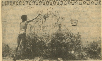
قدموس يعلم الحرف.