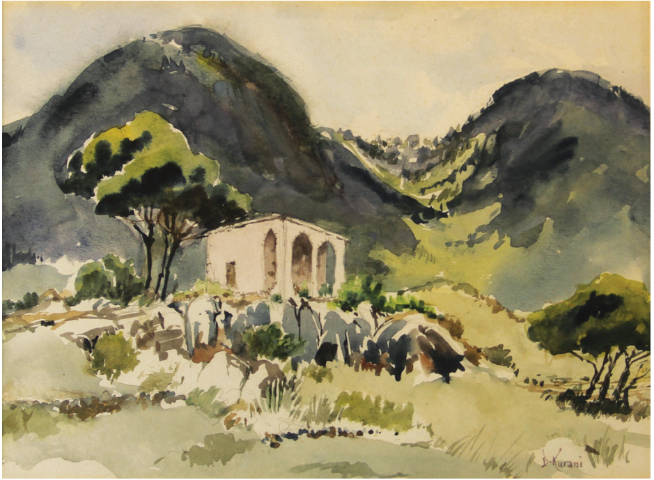
Maameltein , 1996. Watercolor on paper, 39cm x 31.5cm.

معاملتين، ١٩٩٦. ألوان مائية على ورق، ٣٩سم x ٣١.٥سم