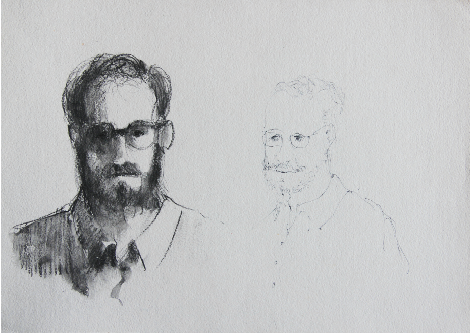
Double Self-Portrait (Before and After), 2012. Graphite on paper, 42cm x 29.7cm

رسم الذات المزدوج (قبل وبعد)، ٢٠١٢. رصاص على ورق، ٤٢سم x ٢٩.٧سم