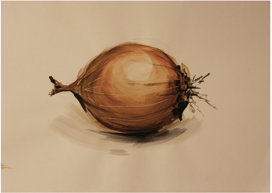
Class Demonstration: Five-Minute Onion, 2014. Watercolor on paper, 42cm x 29.7cm

نموذج في الصف: رسم بصلة في خمس دقائق، ٢٠١٤. ألوان مائية على ورق، ٤٢سم x ٢٩.٧سم