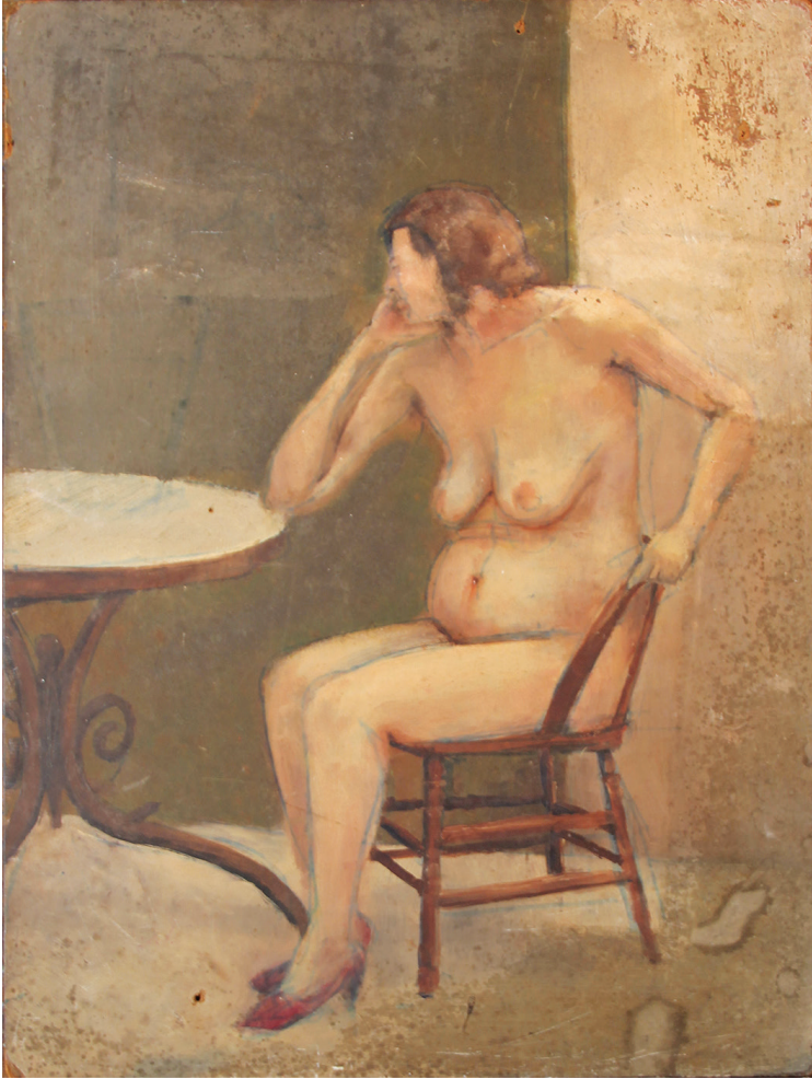
Nude 1 , 1963. Oil on wood board, 40cm x 30cm عاریة ١، ١٩٦٣. زيت علیہ خشب، ٤٠ سم x ٣٠ سم