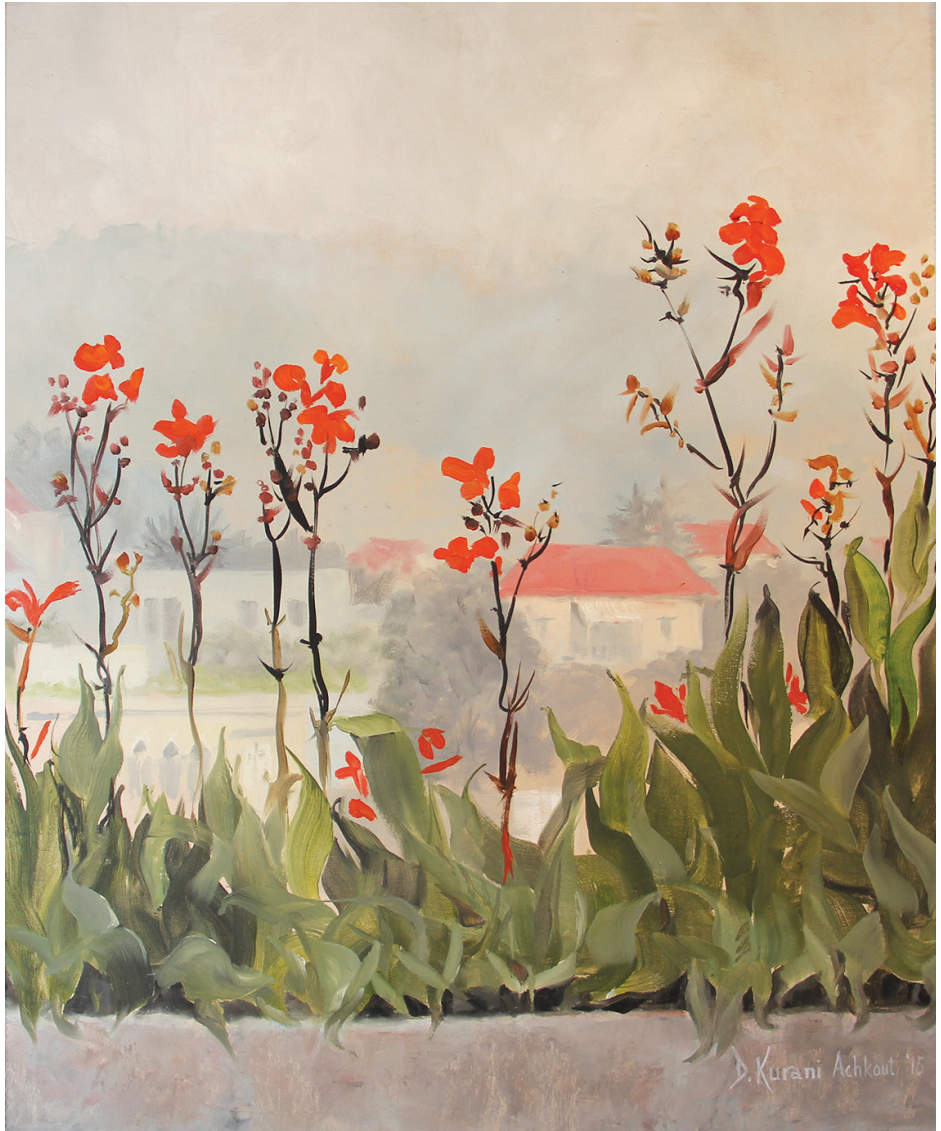
Canna Lilies in Ashqout, 2013. Oil on canvas, 50cm x 60cm

زنبق القنا في عشقوت، ٢٠١٣. زيت على قماش، ٥٠ سم x ٦٠ سم