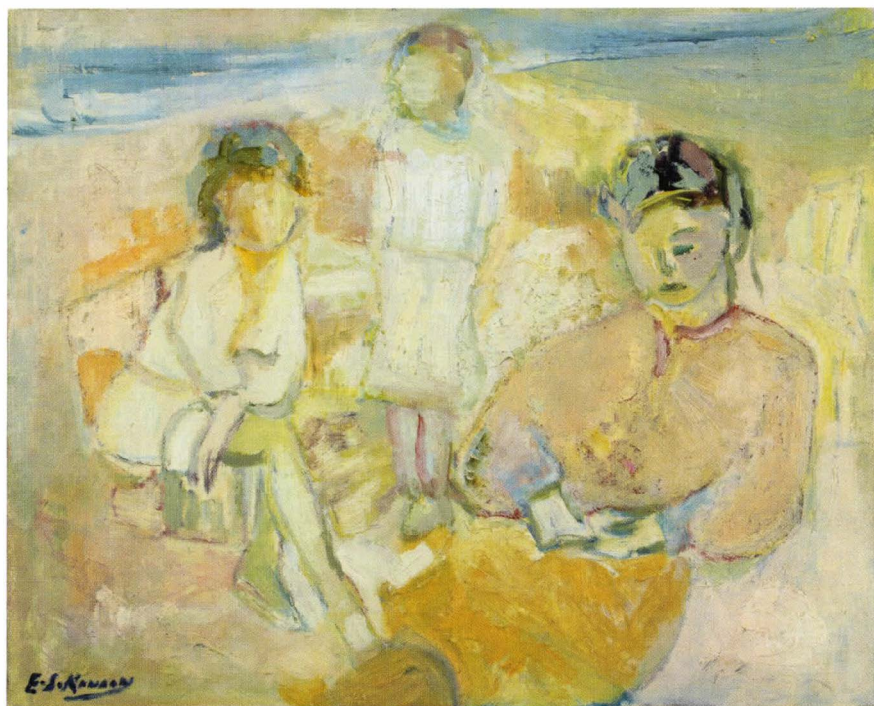
Rêveuses circa 1965 huile sur toile, 32 x 42 cm

Elie Kanaan m'a demandé de dire ce que je pense de sa dernière exposition, et c'est sans réticence que j'accomplis ici cet agréable devoir.