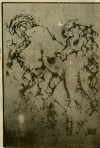
من لوحات هرير

كل لوحة من سلسلة لوحاته، بمختلف مواضيعها، باقة من الزهر يفوح منها عطر الاحساس احساس فنان صادق، احساس هرير.