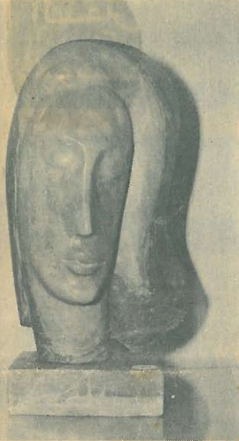
انتيفون بصبوص : الملاحمة والمأساة