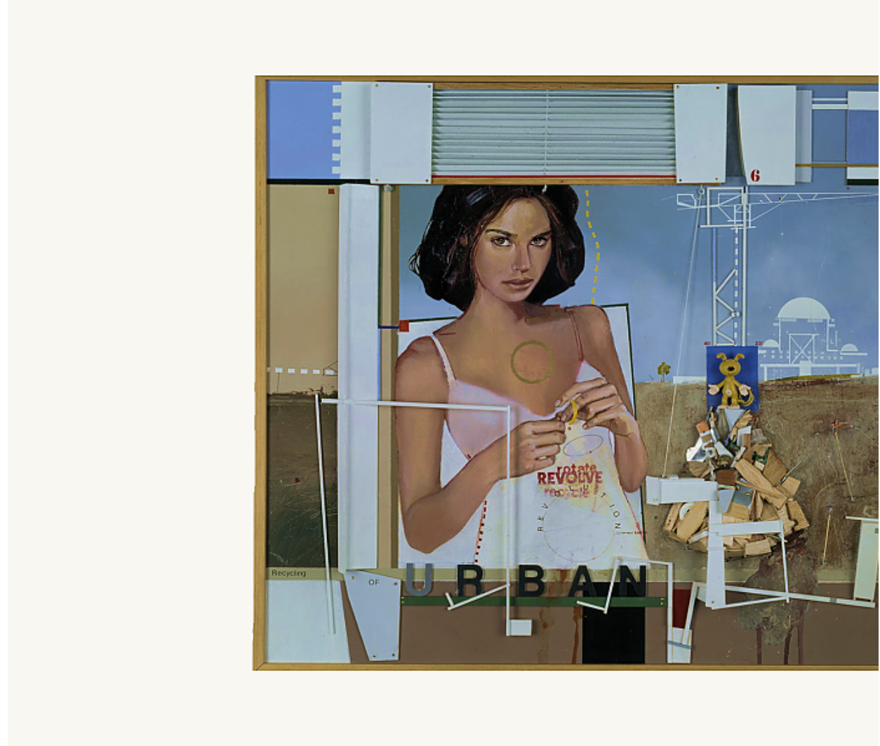
Mohammad Al-Rawas, Urban Debris , 2004. Huile et assemblage sur