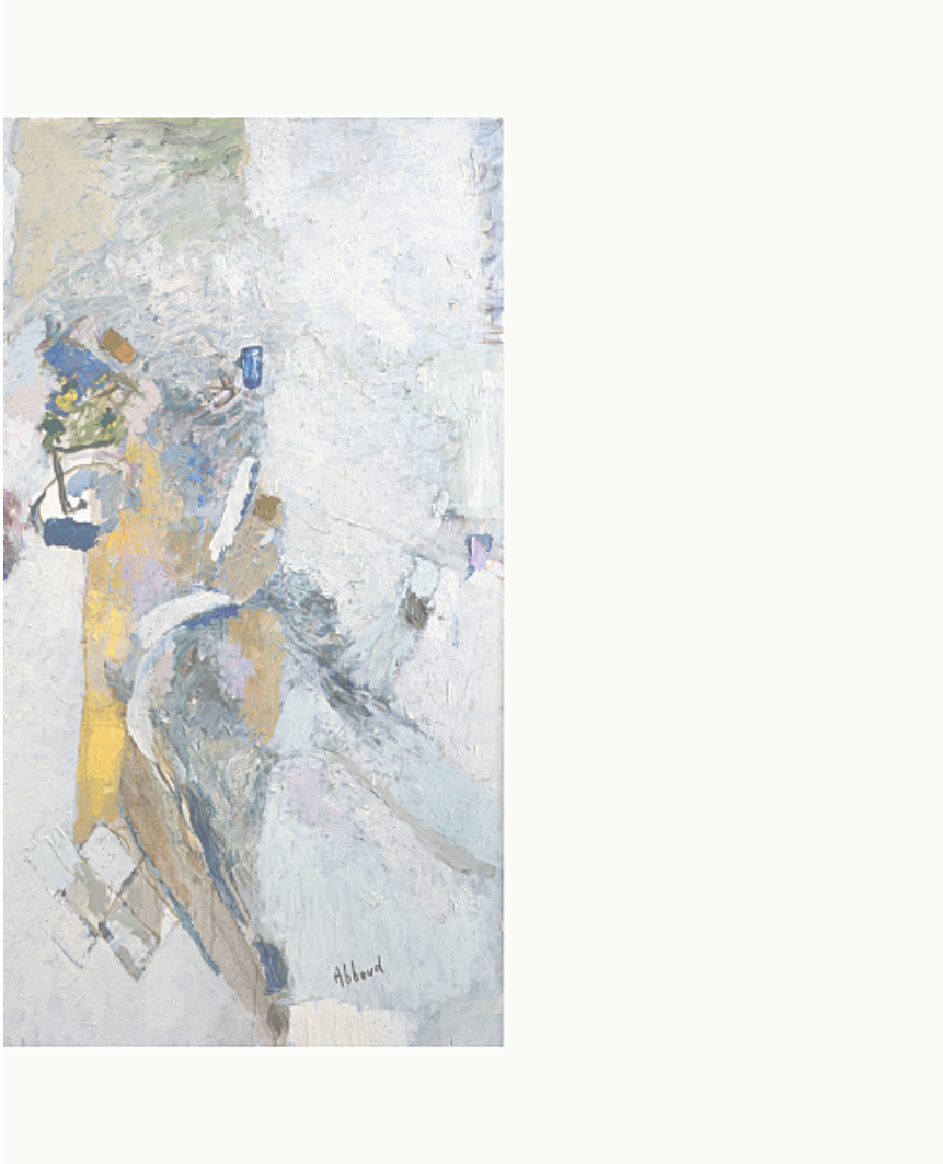
huile sur toile, 105 x 120 cm.