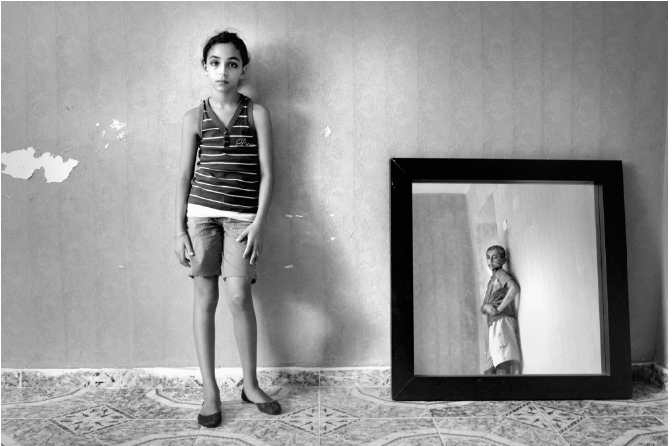
Rania Matar – Forgotten People (2005)

semble défier la caméra, comme il défie les conditions difficiles dans lesquelles il évolue. Dans un contexte particulièrement rude, la photographe parvient à débusquer l'invisible à l'écart de la temporalité de l'actualité des camps, à déceler l'indicible de ces vies ordinaires, tout en critiquant en filigrane une société chargée de paradoxes.