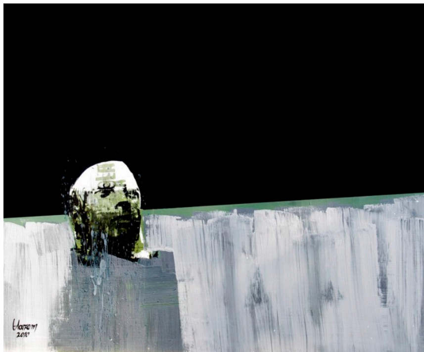
Hazem Harb – Invisibility series

L'artiste Hazem Harb originaire de Gaza aujourd'hui en exil entre Rome et Dubaï, explore le thème de l'existence, à travers un point de vue très personnel et original. Dans sa série de peintures inédites – il s'agit de la collection privée de l'artiste – intitulée Invisibilité (2010), inspirée de l'art conceptuel et de l'expressionnisme, l'artiste dépeint des formes humaines stylisées : on devine çà et là une jambe, une main ou un visage désarticulé, décharné, à peine identifiable. Evoquant l'œuvre de Francis Bacon, des fragments de corps en mouvement se heurtent à des compositions géométriques dans lesquelles ils entrent violemment, comme par effraction. Doté d'une grande maîtrise technique (entre jets et aplats de peintures), l'artiste qui a entrepris ce projet à la suite de la guerre « Plomb Durci » de 2008 sur Gaza, rend les conséquences désastreuses de la guerre plus manifestes encore par la matérialité de la peinture. A l'instar de Goya ou de Picasso, c'est un art qui alerte, qui dénonce les horreurs de la guerre et la vulnérabilité humaine.