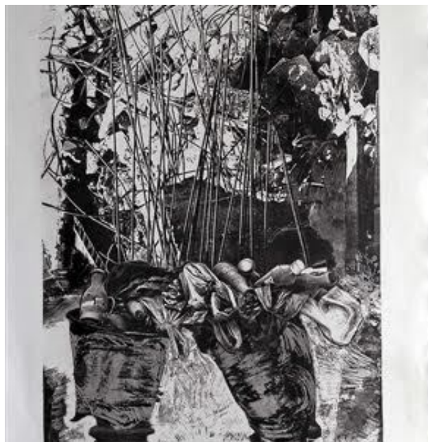
Samira Badran – Siege (2005)

Le travail de Samira Badran explore de son côté, les thèmes de l'immobilité et du confinement liés à l'occupation israélienne. L'œuvre Siege (2005) dépeint une silhouette humaine sans visage, debout, campée dans un univers atemporel indéfini, hostile et inquiétant. Seules les prothèses de jambes sont identifiables dans les compositions saturées. Le choix du noir et blanc et la multiplication des lignes verticales en tension, allégorisent la notion de suffocation et d'aliénation. L'individu dépossédé de son visage et de ses jambes devient la marionnette du blocus. On lui a tout confisqué mais il marche quand même... Tout en revisitant par ses œuvres chargées de détails, l'imagerie de la prothèse en lui attribuant un sens de persévérance, Badran dénonce la violence