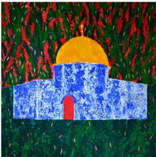
Nasser Soumi – Jerusalem Ascension (2014)

désormais impossible, entre les deux capitales. L'artiste fait appel ici, à l'histoire du fameux chemin de fer du Hedjaz réalisé entre 1901 et 1908, qui reliait à l'époque, Damas à la Mecque, Jaffa à Jérusalem ou encore Gaza à Naplouse. Un temps bien révolu !