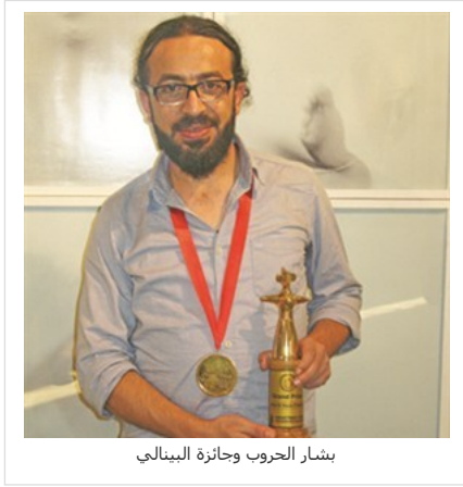
بشار الحروب وجائزة بينالي

ديسمبر 13, 2012 مقالات وأخبار | 0 comments