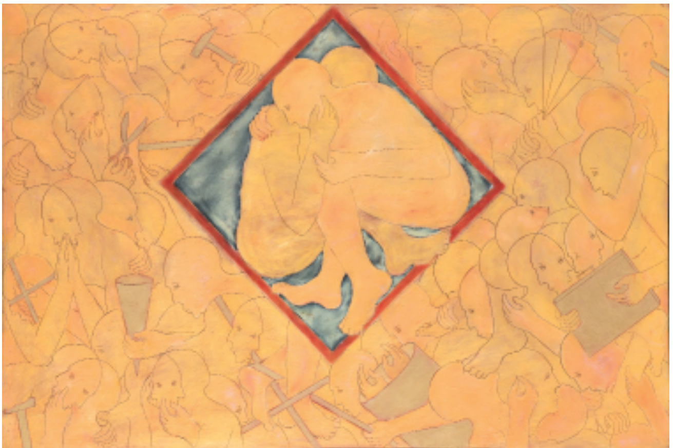
Sans titre 2013 Cire et pigments sur bois h : 300 x 200 cm