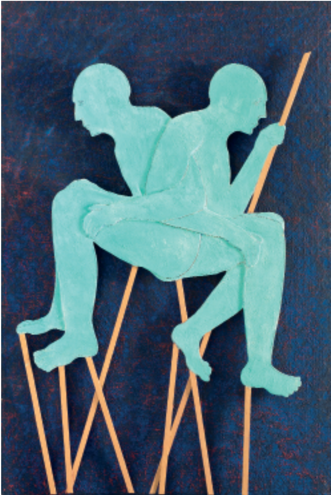
Sans titre 2016 Cire et pigments sur bois h : 226 x 155 cm