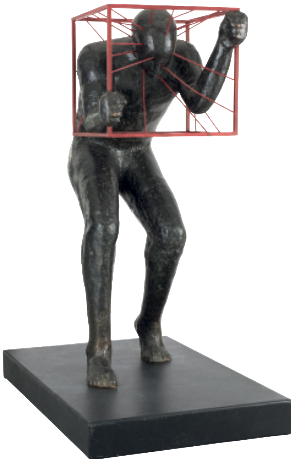
Sans titre 2016 Sculpture en bronze h : 160 cm