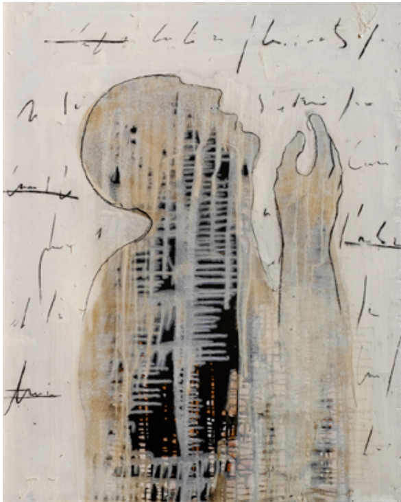
Sans titre 2017 Goudron et huile sur papier h : 80 x 100 cm