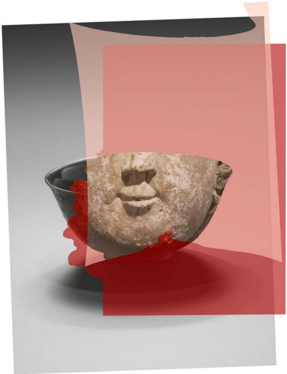
SCRATCHING ON THINGS I COULD DISAVOW Preface to the third edition (Édition française), Plate III, 2013