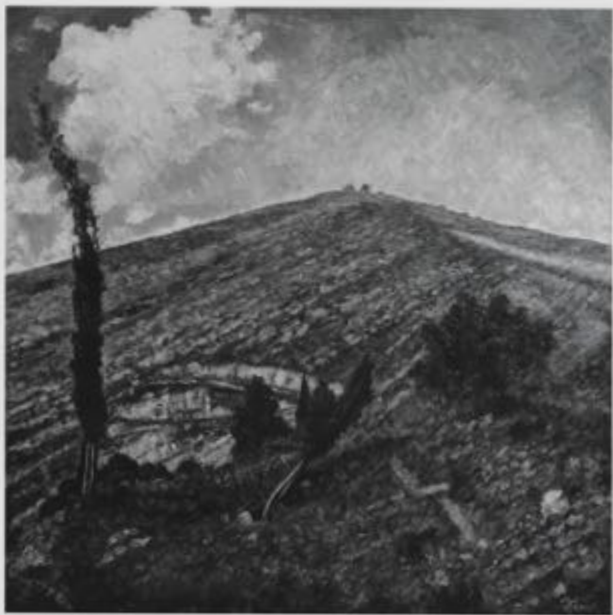
A Skyline Made of Fake Plates, 2013