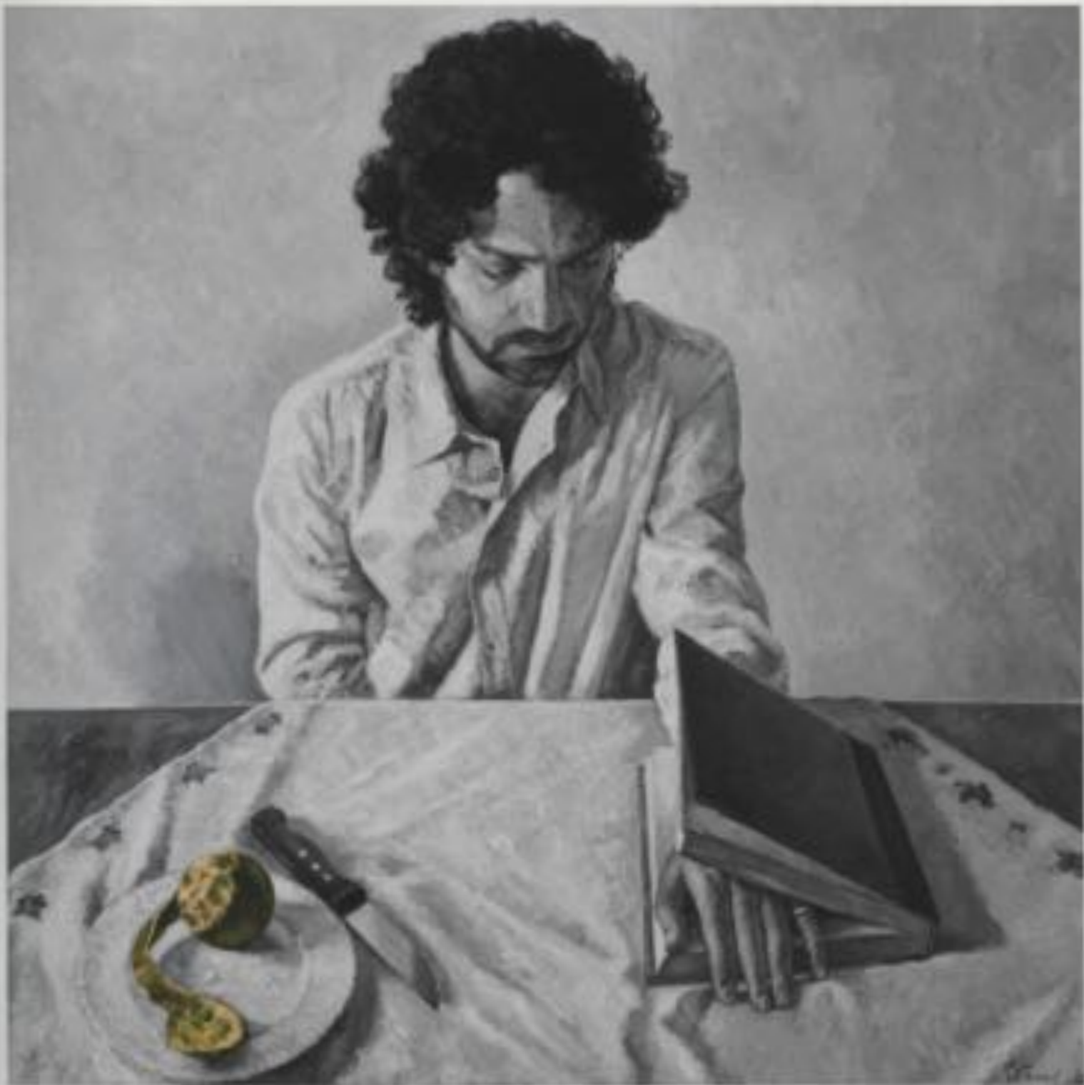
A Damndous Anticipation... Familiarly, 2013