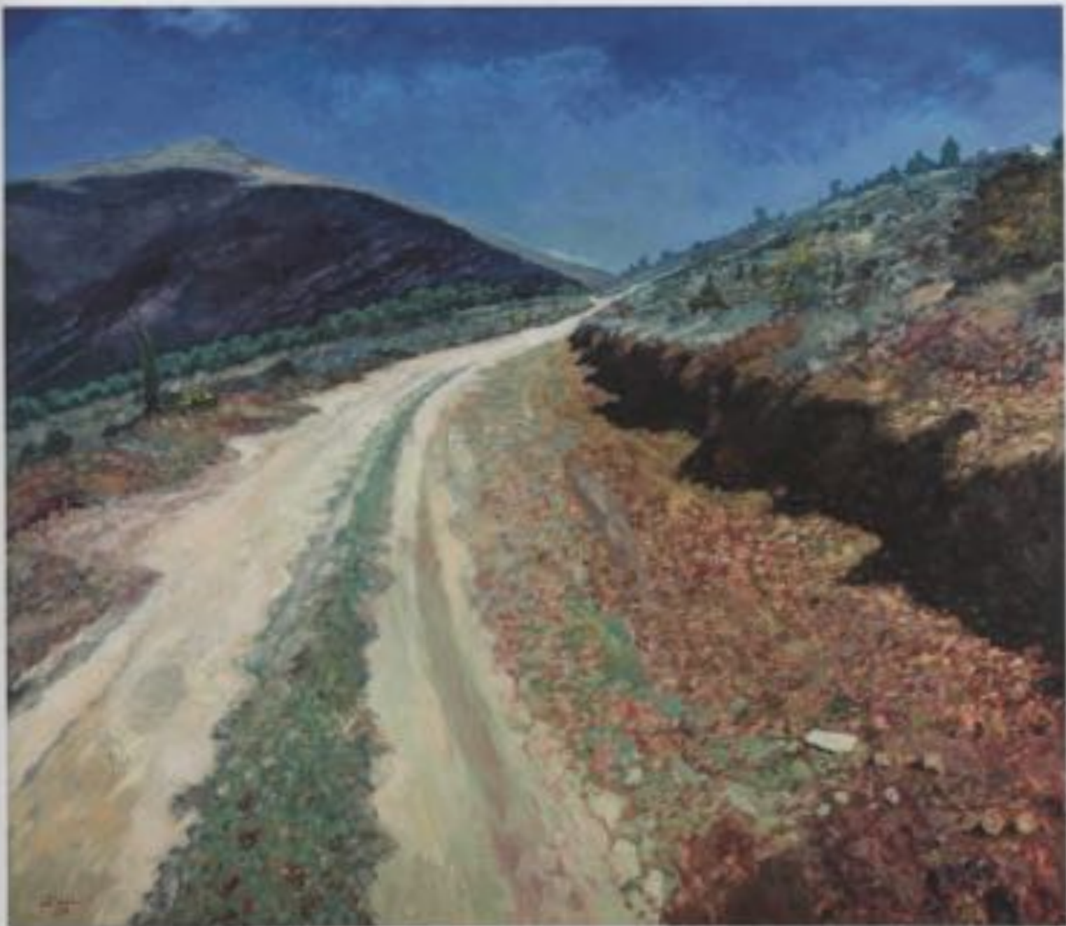
The Breathless Path, 2013 Acrylic on canvas, 190 x 220 cm