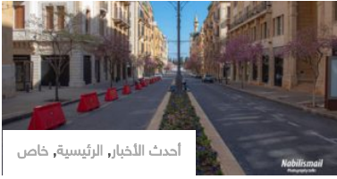
أحدث الأخبار، الرئيسية، خاص

«جنوبية» ينفرد بنشر وقائع الحكم المرعبة و«المقززة».. سوري «يفترس» الأجنيبات في شوارع بيروت بينهن صحافية!