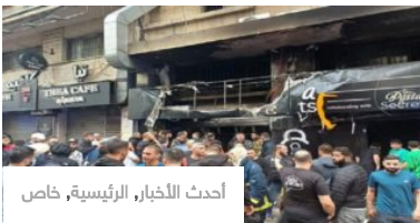
أحدث الأخبار، الرئيسية، خاص