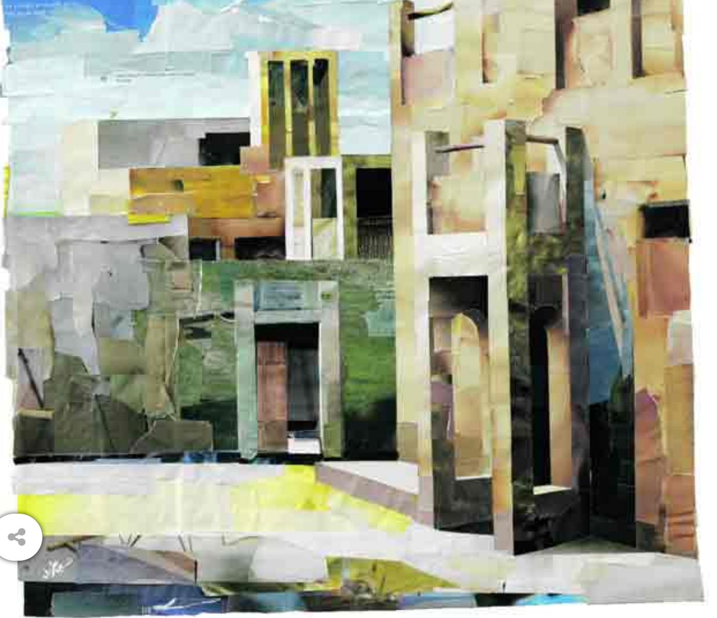
«كولاج» للفنان حسين شريف. «وزارة الثقافة والشباب وتنمية المجتمع»