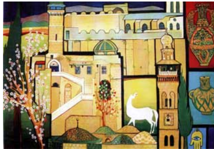
لوحة للفنانة تمام

هي أول فنانة فلسطينية تقيم معرضاً شخصياً بعد عام النكبة، فقد شهدت القاهرة في العام 1954 معرضها الأول، أي بعد معرض الفنان اسماعيل شموط بسنوات معدودة، وهي أول فنانة فلسطينية تتخرج من أكاديميات الفنون التشكيلية «خريجة كلية الفنون الجميلة في القاهرة العام 1957م». وهي بلا مبالغة الرائدة الحقيقية للفن الفلسطيني المعاصر «كرمت في الأسبوع التشكيلي العربي كرائدة من رواد الفن الفلسطيني» والفنانة التي ملكت استمرارية الانجاز عبر مشاركتها في عشرات المعارض الجماعية الفلسطينية وإقامتها لأكثر من ثلاثين معرضاً شخصياً في المدن العربية والأجنبية «القاهرة - القدس - عمان - دمشق - بيروت - الكويت - الجزائر - صوفيا - بلغراد - بكين - لندن .. الخ»