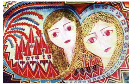
لوحة للفنانة سميرة

تعود بدايات «سميرة» الفنية الى اواخر الستينات، أي الى مرحلة تعبيرية في الفن الفلسطيني المعاصر، ورغم انتشار «التعبيرية» في النصف الثاني من الستينات وتأثير من الواقع الفلسطيني الجديد «الثورة» فإن «سميرة» قد بدأت بداية مختلفة وتطورت لتمثل الاتجاه الزخري في الذي تم عبر عناصر تراثية فلسطينية محددة.