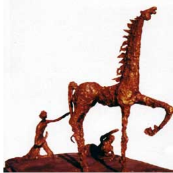
لوحة للفنانة نازك