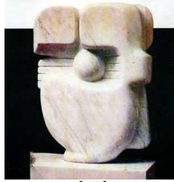
لوحة للفنانة منى

وهكذا تكشف لنا هذه التجارب الرائدة عن مدى مساهمة «المرأة» في بناء حركة تشكيلية فلسطينية معاصرة، ومتميزة في ارتباطها بالقضية.