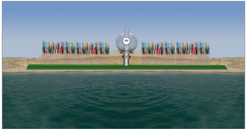
جدارية الامن والسلام بالقناة الجديدة