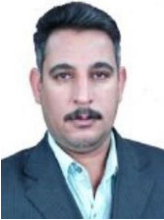
• (خضير الزيدي : قريبا من أغنيات الله (إلى حسين السلطاني) (ملف/5)