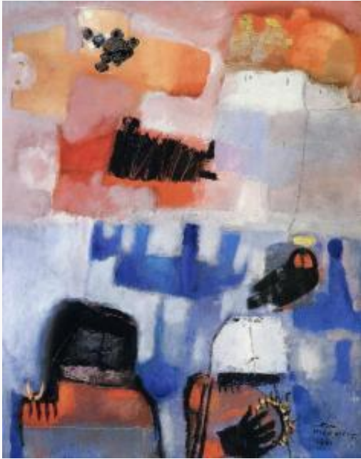
من أعمال الفنان الراحل فاتح المدرس

1963، وجائزة الدولة السورية للفنون سنة 1968، وأيضاً حاز جائزة استحقاق من المعرض الدولي في جامعة كليفلاند- فلوريدا، وجائزة السوري من الدرجة الممتازة الذي منحه إياه الرئيس بشار الأسد تقديراً لأعماله الفنية التشكيلية.