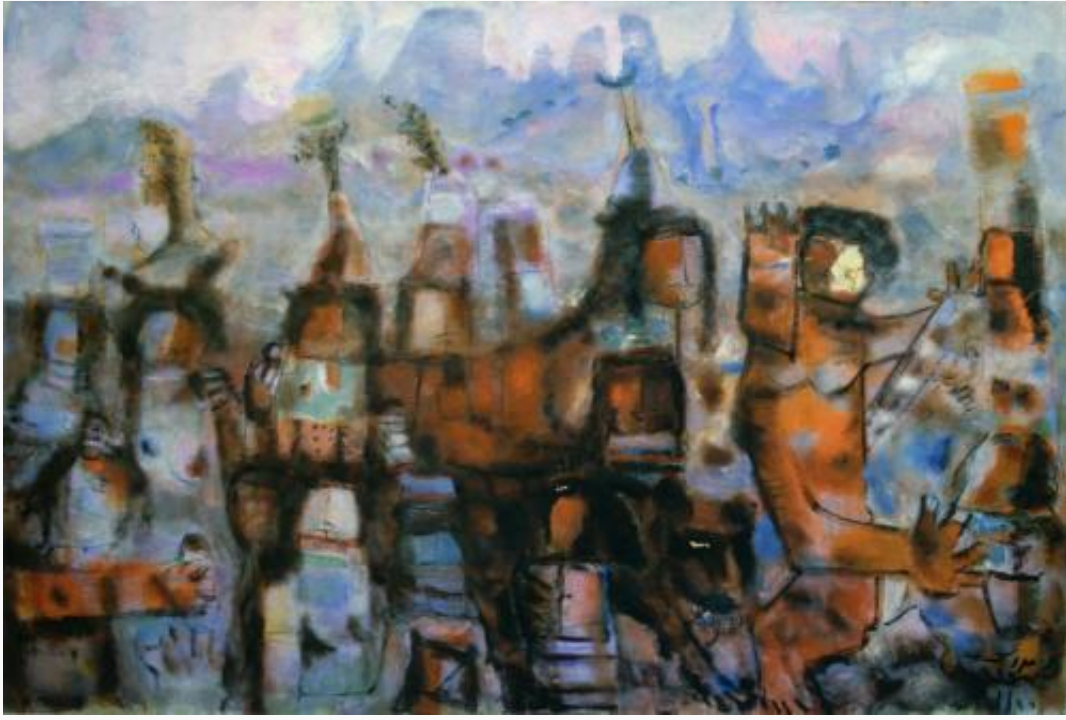
من أعمال الفنان الراحل فاتح المدرس

وجائزة كرومباكر من جامعة كليفلاند فلوريدا «الولايات المتحدة الأميركية»، وفي عام 1952 نالت لوحته «كفرجنة» جائزة المعرض الثالث للفنون التشكيلية في المتحف الوطني بدمشق، وفي عام 1962 نال الميدالية الذهبية لمجلس الشيوخ الإيطالي، وجائزة شرف من بينالي ساو باولو لعام