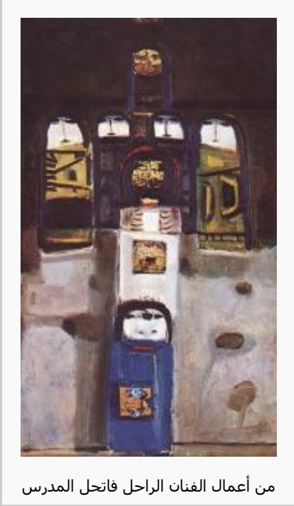
من أعمال الفنان الراحل فاتح المدرس

وضع مؤلفاً فيه «موجز تاريخ الفنون الجميلة»، وقدم عدة دراسات مثل «دراسة لتاريخ الفنون في اليمن قبل الميلاد»، و«دراسات في النقد الفني المعاصر» في عام 1954، إضافة إلى مجموعة محاضرات عن فلسفة الفنون ونظرياته عام 600 ق. م، وكتب مجموعتين شعريتين، الأولى عام 1959 بعنوان «القمر الشرقي يسطع على شاطئ الغرب» بالاشتراك مع شريف خزندار، والمجموعة الثانية كانت في أواخر الثمانينيات، كانت بالاشتراك مع الشاعر حسين راجي، كما أصدر مجموعة قصصية كتبها بمفرده وأطلق عليها «عود النعناع».