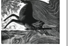
لوحة "معركة الكرامة" 1969 للحلاج (مواقع التواصل)

ورغم رمزيتها وأفكارها المتجاوزة، لا تُفارق أعمال الحلاج حاضرها القائم في التعبير عن الذات الفلسطينية المقاومة، سواء على جبهة القتال أو جبهة المقاومة الثقافية. وعلى جبهة اللوحة نجد فلسطين في إيقاعات تشكيلية مُعبّرة بدقة منطقية رغم رمزيتها عن مسيرة الحلاج كفنان ومعاناته كلاجئ سياسي.