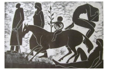
"فلسطين" لمصطفى الحلاج

وبالرغم من أن أعمال الحلاج في عالم الحفر تعد معاجم بصرية ضخمة تدور في أفق الرموز الغير مألوفة. إلا أنها لا تعتبر سريرية على حد ما قدمت السريالية نفسها في مانفيسستو أندريه بريتون. [3] فالسريالية بالرغم من أنها مزجت الواقع والخيال بالدمج بينهم، واعتمدت على اللاوعي والأشكال غير المنطقية. لكن تظهر حفريات الحلاج رغم رمزيتها واعية وعاقلة بكل رمز وبقدرة الرائي على فهمه وتفسيره.